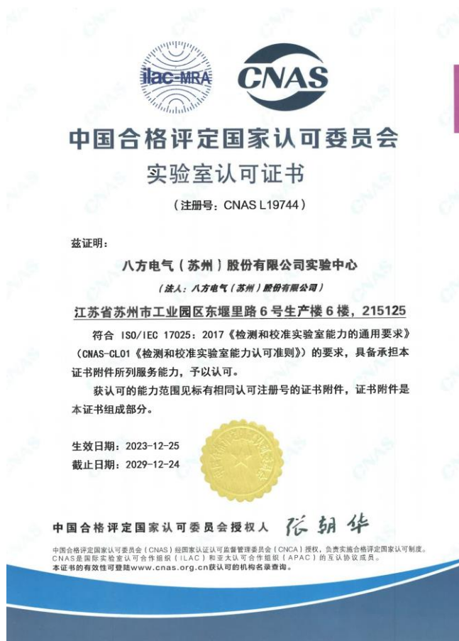
CNAS 实验室认可证书

产品质量是企业生存与发展的根本，八方电气（苏州）股份有限公司致力于打造两轮驱动系统行业的世界级专业检测实验室，为产品质量建造坚实的防护墙。在品质管理工作持续升级的进程中，八方实验中心于 2023 年 12 月 25 日正式通过中国合格评定国家认可委员会（简称“CNAS”）认可，荣获 CNAS 实验室认可证书。