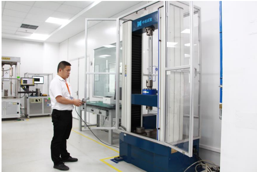
八方质量工程师在机械可靠性实验室验证产品能力

CNAS 由中国国家认证认可监督管理委员会（CNCA）批准设立并授权，统一负责对认证机构、实验室和检验机构等相关机构的认可工作，已与全球众多机构实现检测结果的国际互认，可助力企业加快产品认证与项目推进，将有利于八方及其上下游合作伙伴更快速精准地应对市场需求。