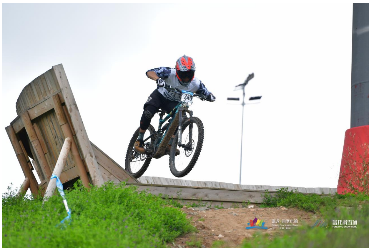
EBIKE 耐力赛, 图源: 富龙

富龙山地车嘉年华是目前国内赛道场地最专业、参赛选手最多、组别最丰富的山地自行车赛事。今年赛事将历时 9 天，共有来自 10 个国家的 778 名选手参与，设置了 35 个不同组别的比赛项目，包括泵道、山地速降、亲子接力、攀爬赛、Enduro 耐力赛、甩尾赛等多种类型。